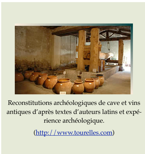
Reconstitutions archéologiques de cave et vins antiques d'après textes d'auteurs latins et expérience archéologique.

Affaire à suivre dans notre prochaine e-pistula . Vous serez de toute façon avertis, en temps utile, par notre scriba maxima , F. Nicolet.